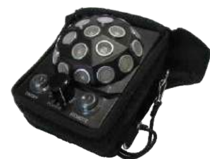
多向超音波發射器